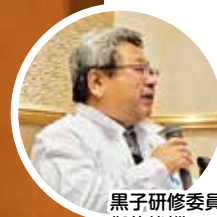
黒子研修委員長が 御礼挨拶