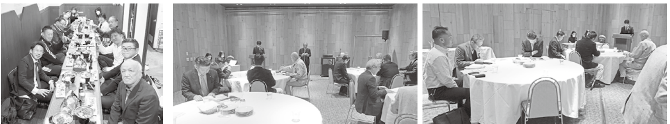
3/13 千葉北ブロック 第2回 役員会