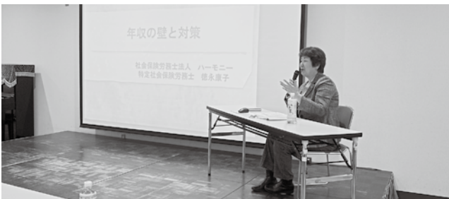
3/5 ブロック合同研修会①