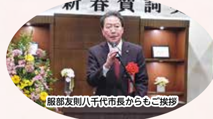
服部友則八千代市長からもご挨拶