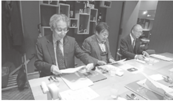
2/19 第4回正副会長・総務委員長会議