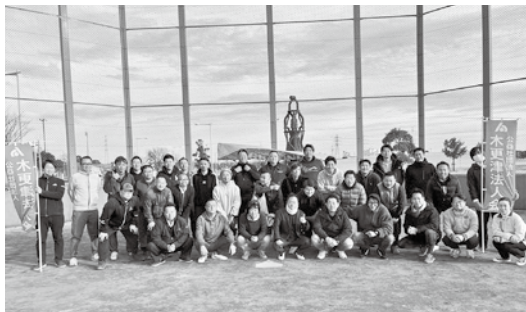
2/16 青年部会 4会合同交流事業