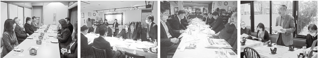
1/17 千葉西ブロック 支部長会議