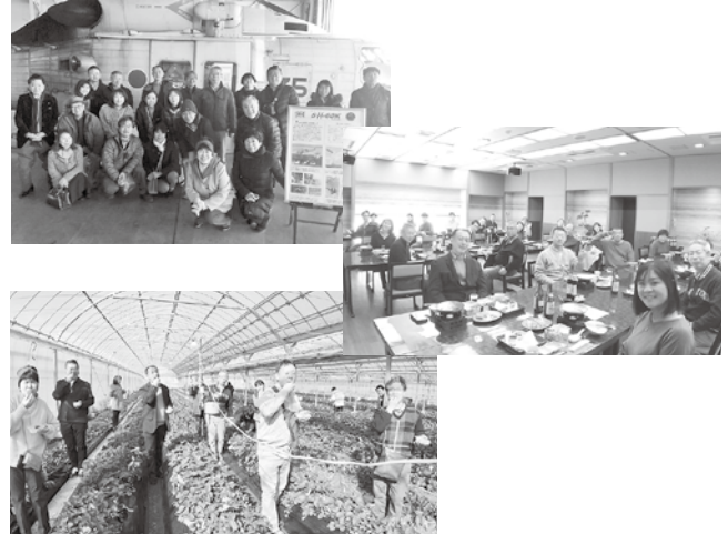
2/28 習志野ブロック管外研修会