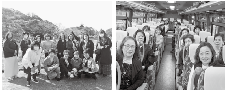
2/20 女性部会管外研修会