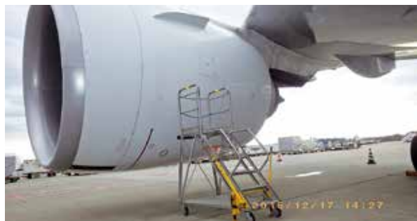
国際空港に納入された整備用タラップ