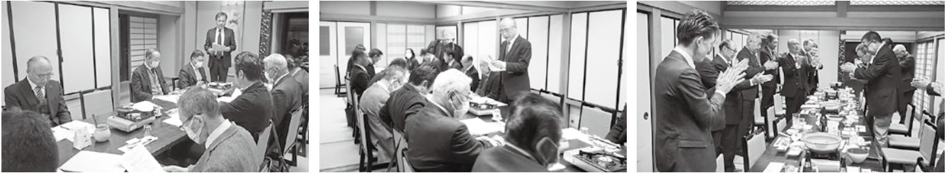
1/16 八千代ブロック 第2回 役員会