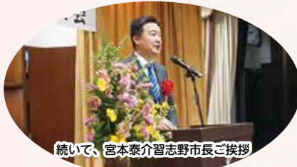
続いて、宮本泰介習志野市長ご挨拶