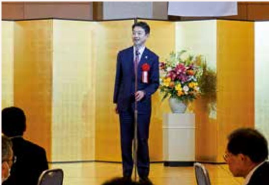
熊谷俊人千葉県知事からの祝辞