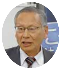
社会保険労務士法人 曾我事務所 代表