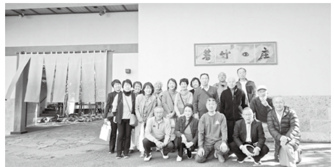
3/15-16 千葉北ブロック管外研修会