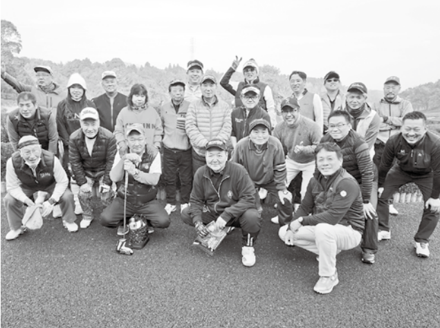
1/23 千葉北ブロック新会員歓迎ゴルフ大会