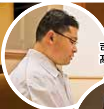
司会は、 高際研修委員