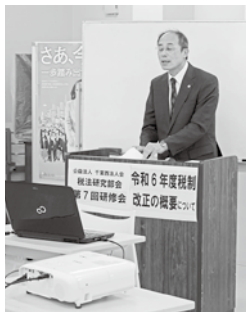
3/1 税法研究部会第7回研修会