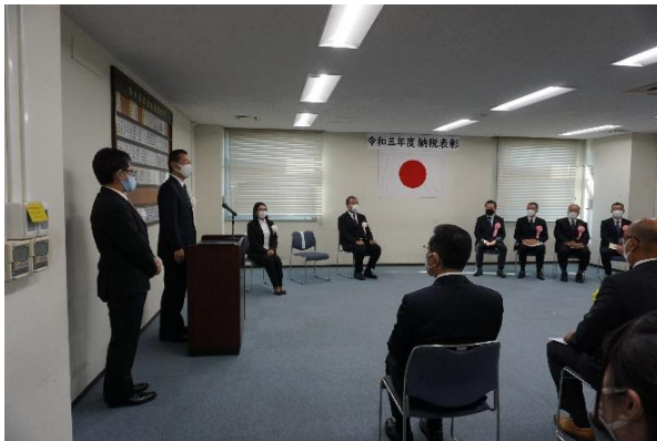
11/15 於、千葉西税務署 (授与式の様子)