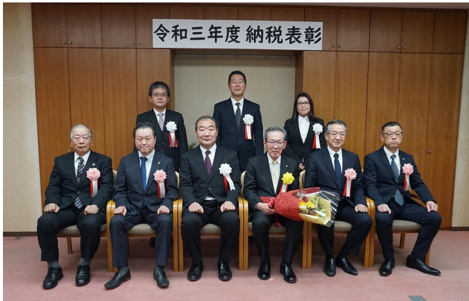
(千葉西税務署 署長表彰)